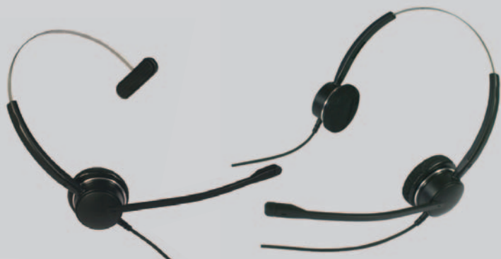
BusinessLine 3000 X5/XD